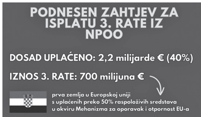
Slika 1. Zahtjev za isplatom treće rate u okviru Nacionalnog plana oporavka i otpornosti 3

Treći zahtjev Hrvatske za plaćanje 700 milijuna eura (bez predfinanciranja) obuhvaća 32 ključne etape i 13 ciljnih vrijednosti (Slika 1.). Njima su obuhvaćena ulaganja u područjima kao što su zaštita od poplava, recikliranje komunalnog otpada, digitalizacija administrativnih, zdravstvenih i pravosudnih usluga, energetska obnova zgrada, održivi, zeleni i digitalni turizam, kupnja seizmičke opreme i izgradnja skele „Križnica“ 2 . Zahtjev za plaćanje uključuje i niz reformi za promicanje uporabe obnovljivih izvora energije i poboljšanje upravljanja u sektorima voda, otpada, pomorstva i turizma, s naglaskom na održivosti. Daljnje reforme odnose se na područja javne nabave, visokog obrazovanja, zdravstva, tržišta rada, uključujući suzbijanje neprijavljene rada te uspostavu jedinstvene internetske kontaktne točke za obnovu nakon potresa i energetska obnovu.